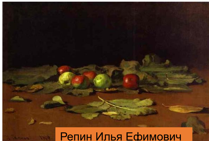
Репин Илья Ефимович