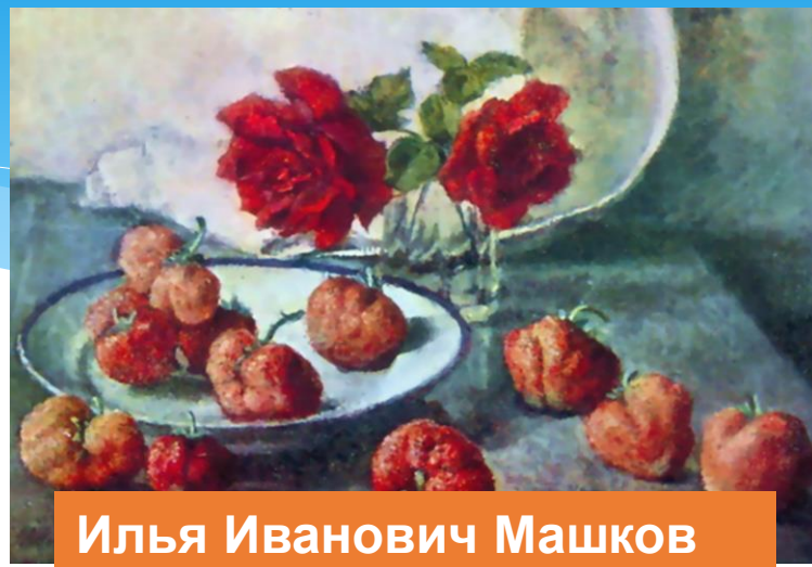
Илья Иванович Машков